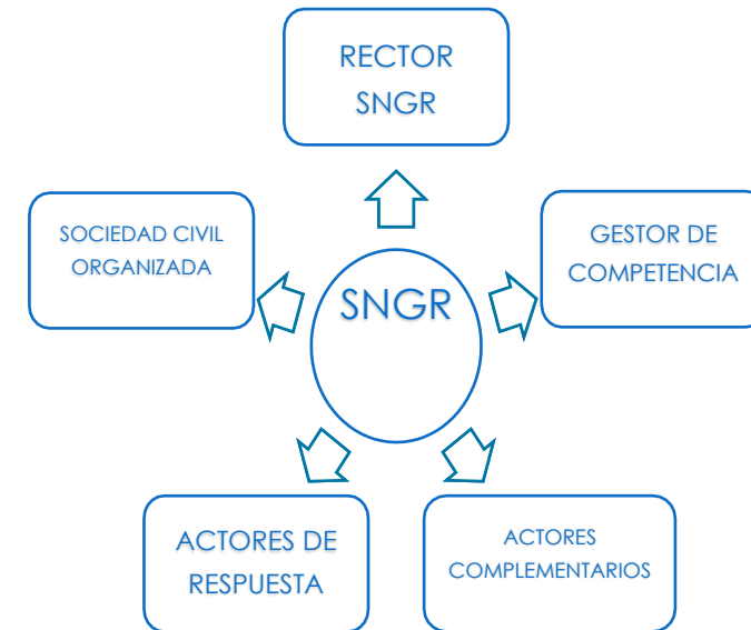
Gráfico 2 Actores del Sistema Nacional Descentralizado de Gestión de Riesgos (SNGR)

Fuente: Servicio Nacional de Gestión de Riesgos y Emergencias Elaboración: Equipo Consultor, 2024