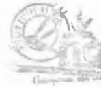
Lic. Germania Ullauri Vallejo ALCALDESA DEL GAD MUNICIPAL SAN FELIPE DE OÑA

Descentralización, la SANCIONO y dispongo su publicación, Ejecútese y publíquese.- Oña, 10 de abril de 2015.