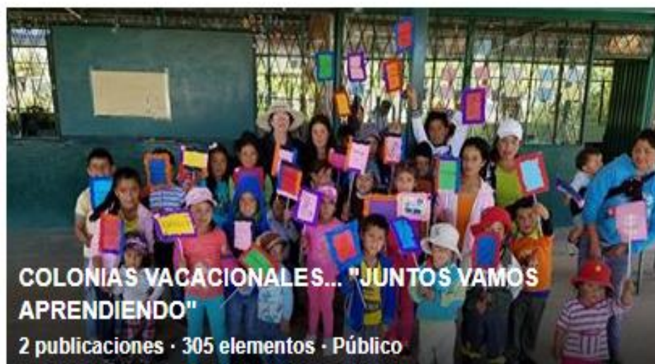
COLONIAS VACACIONALES... "JUNTOS VAMOS APRENDIENDO"

2 publicaciones · 305 elementos · Público