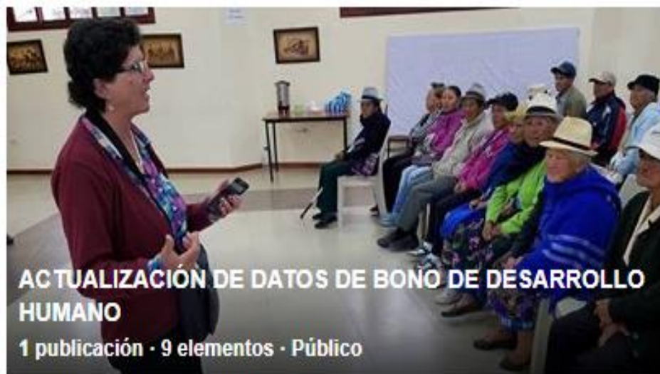
ACTUALIZACIÓN DE DATOS DE BONO DE DESARROLLO HUMANO