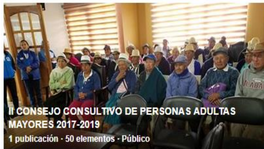
II CONSEJO CONSULTIVO DE PERSONAS ADULTAS MAYORES 2017-2019