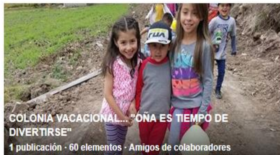
COLONIA VACACIONAL... "OÑA ES TIEMPO DE DIVERTIRSE"

2 publicaciones · 305 elementos · Público